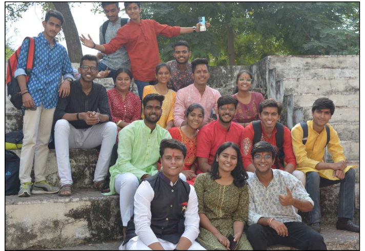
Diwali Celebration in the college for all staff and students